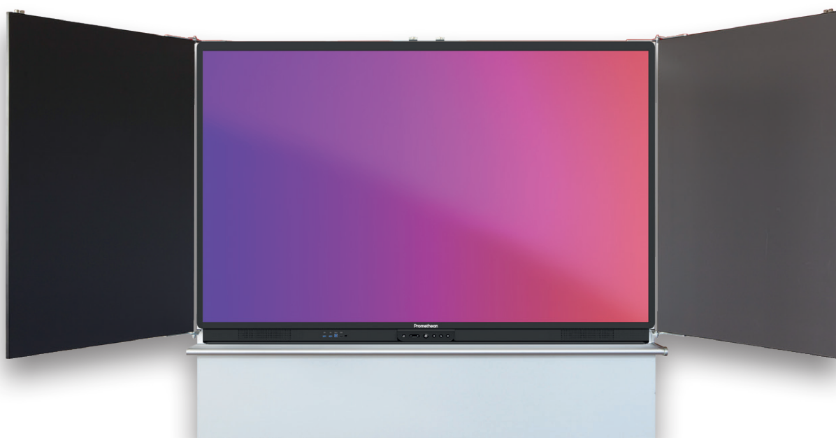
Tableau conventionnel pour écoles et autres lieux de formation. Les surfaces d'écriture en acier émaillé sont magnétiques et résistantes au rayures avec différentes options de réglures qui sont durables et résistent à l'abrasion. Chants en ABD anti-choc. La surface centrale est prévue pour l'intégration d'écrans de 75" ou 86".