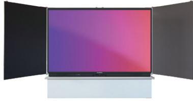
Modell 1R410-5 mit 86" Display (5 Flächen, mittig immer Display)