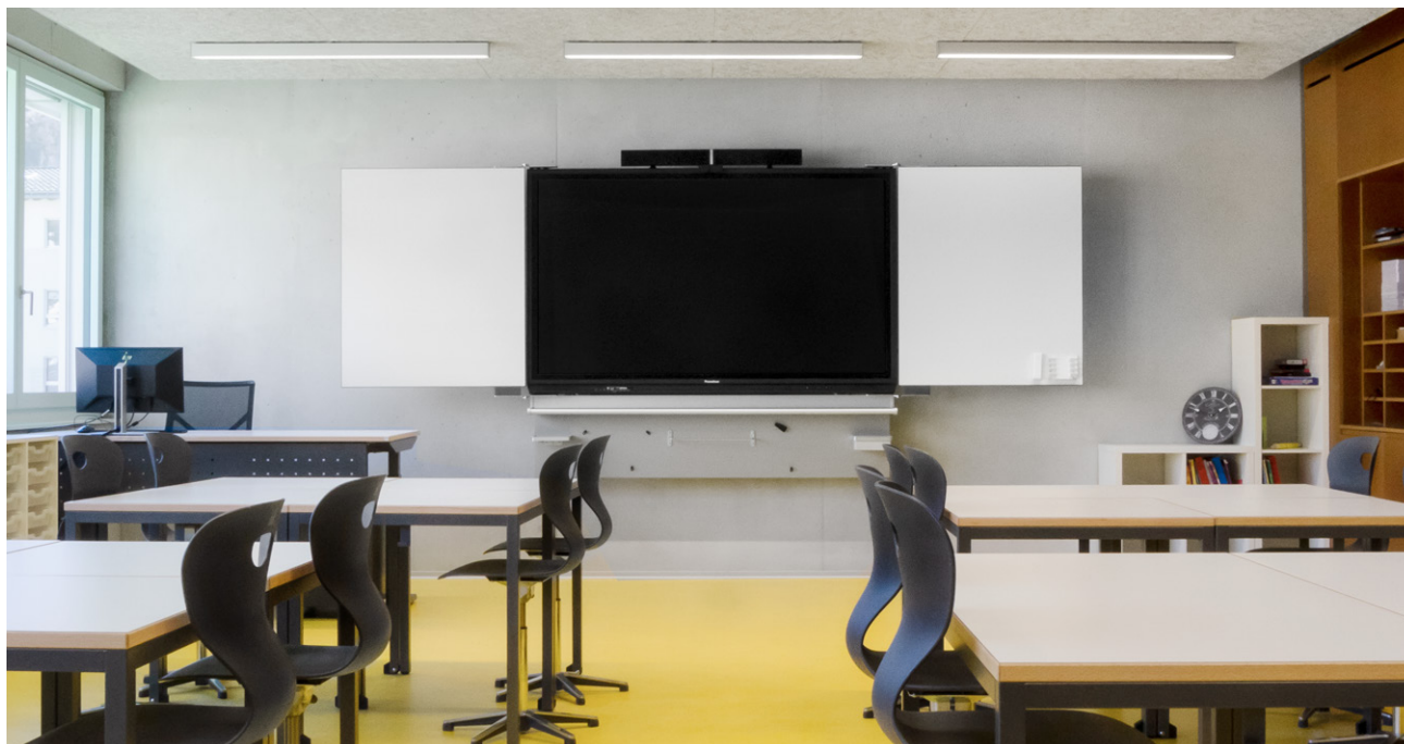
Schule Naters VS: Wandtafel 5-flächig mit Whiteboard und integriertem ActivPanel 86"