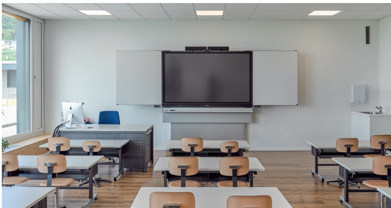
Schule Gilly VD: Wandtafel 5-flächig mit unterschiedlichen Lineaturen und integriertem ActivPanel 86"

01.2024 200 Stück Technische Änderungen vorbehalten