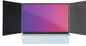
Modell 1R410-5 mit 75" Display (5 Flächen, mittig immer Display)