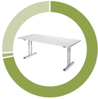
Classification par cycles