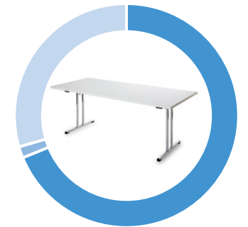
Lebensdauer / Verwendung der Teile