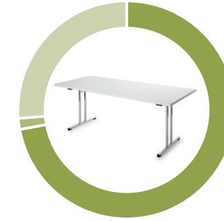
Gliederung der Teile in Zyklen