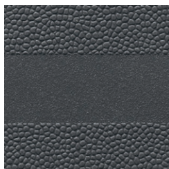
Grau ähnlich RAL 7015