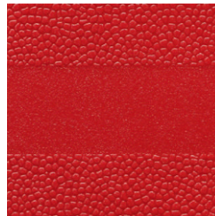
Rot ähnlich RAL 3013