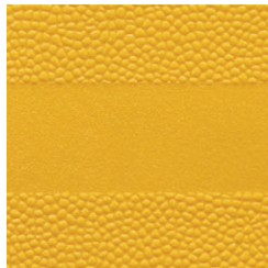
Ginstergelb ähnlich RAL 1032

Die Schale ist eine 2-komponentige Polypropylen-Schale und wird im «Monosandwichverfahren» hergestellt. Durch den hohen Glasfaseranteil im Kernbereich (60% Spezial-Lang-Glasfaser) und Oberflächenbereich (20% Normal-Glasfaser) ist die Schale einerseits stark belastbar und andererseits angenehm elastisch