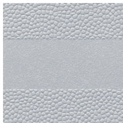
Lichtgrau ähnlich RAL 7035