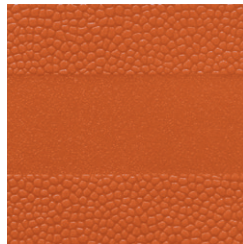
Rotorange ähnlich RAL 2001