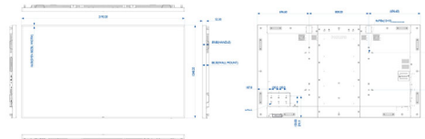
Philips 98BDL4150D Technische Zeichnung