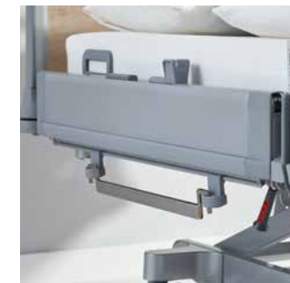
Normschienen für die Intensivpflege