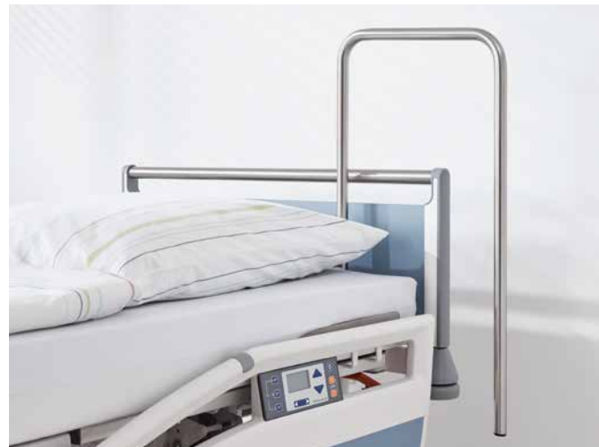
▲ Der Haltebügel eignet sich für den Einsatz auf der Intensivstation.

Ist am Bett ein Aufrichter vorhanden, lässt sich daran ein Infusionshalter mit 4 Haken selbstverriegelnd befestigen. Für unseren Stretcher Mobilo steht ein 2-fach teleskopierbarer Infusionsständer zur Verfügung, der an allen 4 Ecken befestigt und bei Nichtgebrauch mithilfe einer optionalen Halterung am Fußende verstaut werden kann. Dank seiner schwenkbaren Haken benötigt er dort nur wenig Platz. Für die Intensivstation eignet sich besonders der stabile Haltebügel , an dem medizinische Ausrüstung sicher befestigt werden kann.