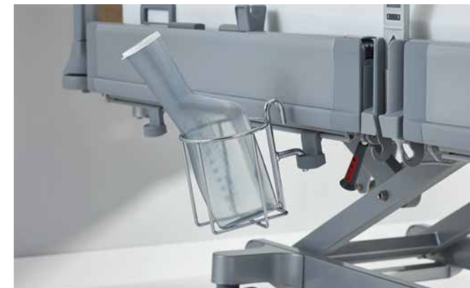
▲ Der Urinflaschenkorb für die MultiFlex + -Seitensicherung des Puro mit flexiblen Montagehöhen für die tief absenkbare Liegefläche.