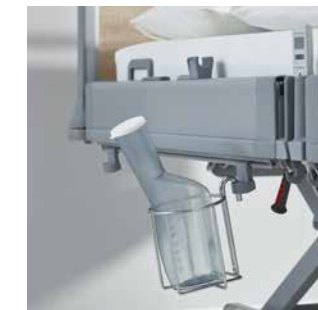
Universalhalterungen und Urinflaschenkörbe