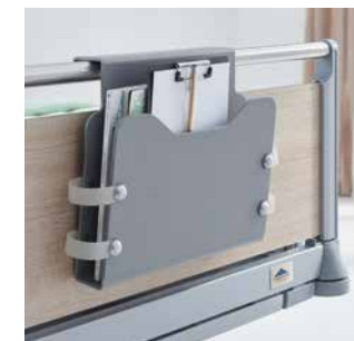
Zubehör am Fußteil immer aktuell und griffbereit