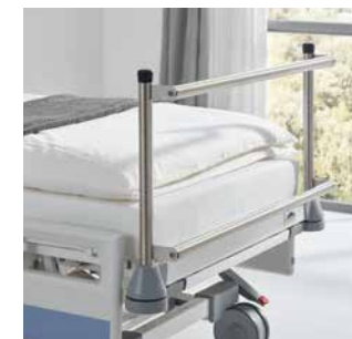
Extensionsgeräte präzise befestigen