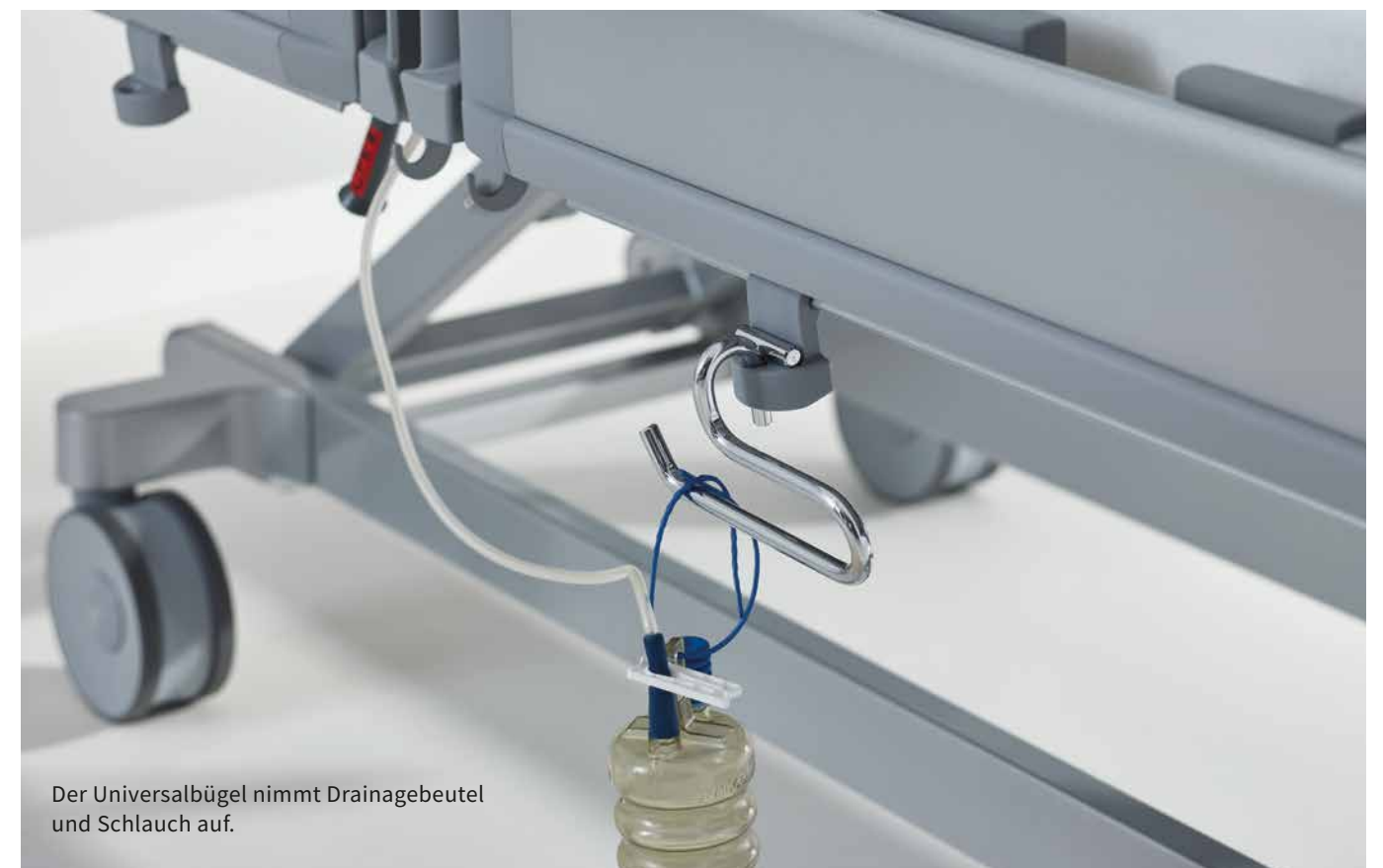
Der Universalbügel nimmt Drainagebeutel und Schlauch auf.

Urinflaschen sollten im Bedarfsfall schnell griffbereit und sicher vor dem Kippen geschützt sein. Unsere Urinflaschenkörbe erfüllen diese Anforderungen optimal. Wir bieten Modelle mit maßgeschneiderten Halterungen für verschiedene Klinikbetten und Ausstattungen an – zum Beispiel für die MultiFlex + -Seitensicherung an unserem Puro oder die Seitensicherung Protega am Evario.