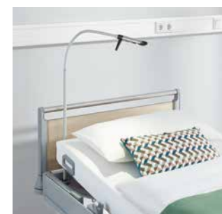
Leuchten direkt am Bett