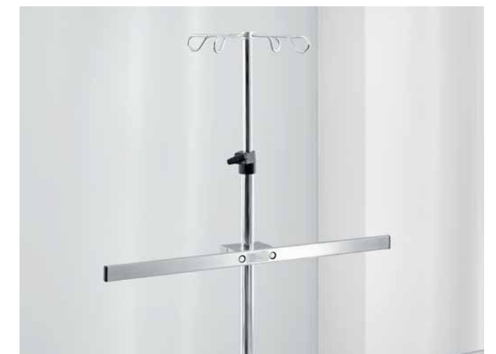
▲ Die Normschiene für den Infusionsständer ermöglicht die platzsparende Positionierung von Zubehör auf Augenhöhe, z. B. Infusionspumpen.