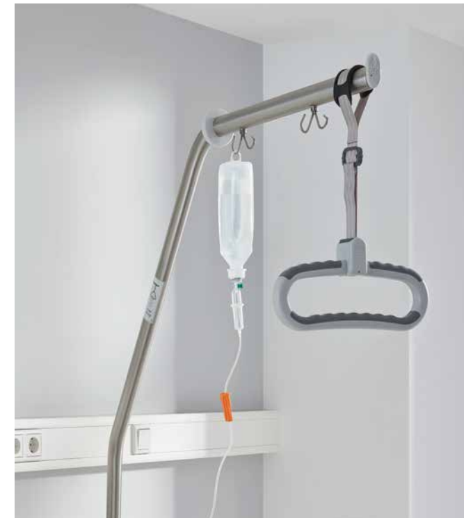
▲ Doppelhaken für Infusionen ermöglichen die sichere Versorgung des Patienten. Der Softtouch-Haltegriff ist besonders rutschfest.