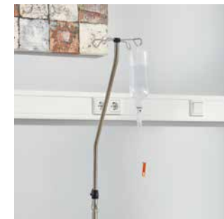
Infusionsständer für eine sichere Versorgung