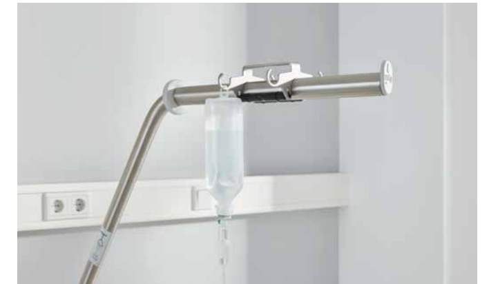
▲ Der Infusionshalter mit 4 Haken lässt sich am Aufrichter befestigen