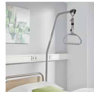
Aufrichter für Komfort und Entlastung

Krankenhausbetten von Stieglmeyer bieten bereits in ihrer Grundausstattung viele Wahlmöglichkeiten. Mit dem passenden Zubehör werden sie zu maßgeschneiderten Wunschbetten, die auf die Bedürfnisse der Patienten eingehen und die Pflegekräfte erheblich entlasten. Im Mittelpunkt stehen dabei die optimale medizinische Versorgung, mehr Sicherheit für die Pflegebedürftigen und eine höhere Lebensqualität im Alltag. Die Zubehöre können auch nachträglich erworben und mühelos an- oder abmontiert werden. Steigern Sie die Außenwirkung Ihres Hauses, verbessern Sie die Versorgung der Patienten und schützen Sie Ihre wertvollen Investitionen.