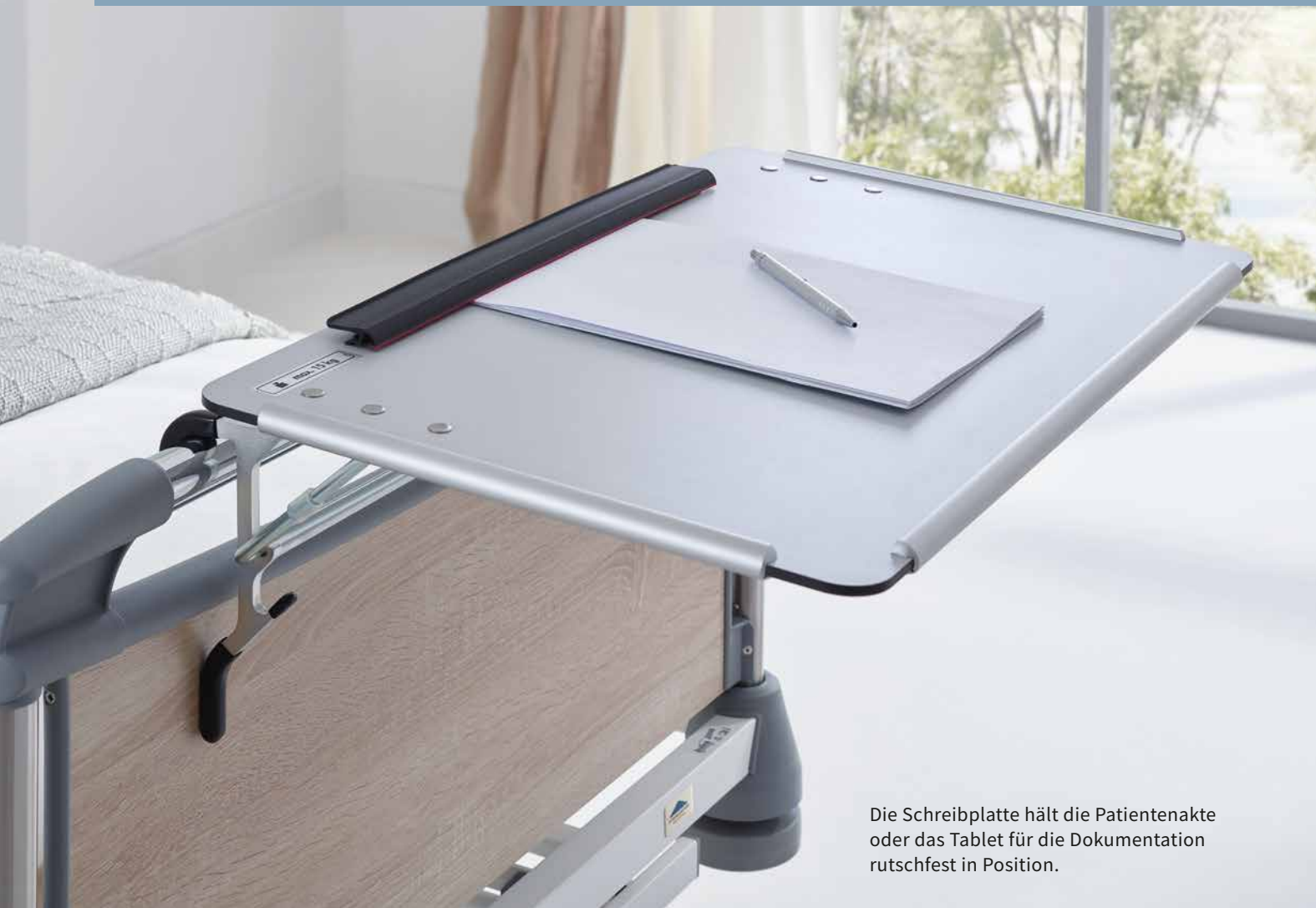
Die Schreibplatte hält die Patientenakte oder das Tablet für die Dokumentation rutschfest in Position.