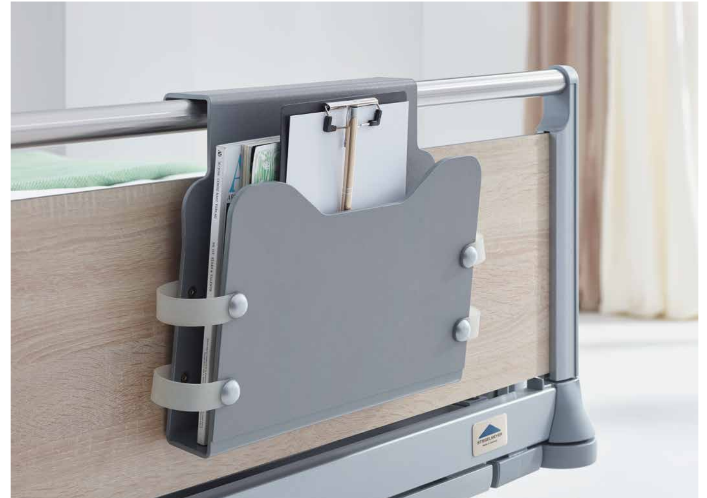
▲ Die Dokumentenhalterung im modernen Farbton Argentum passt gut zu jedem Bett.