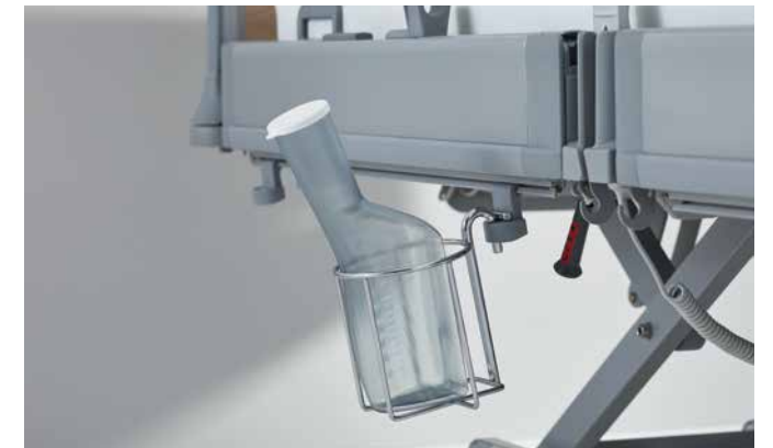
▲ Der Urinflaschenkorb zum Anhängen an der Bettseite.