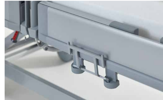
▲ Der Universalhalter am Klinikbett Puro mit flexiblen Montagehöhen für die tief absenkbare Liegefläche.