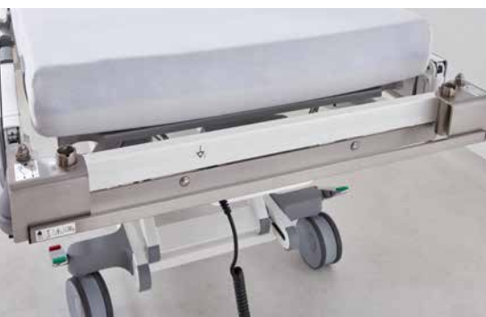
◀ Normschiene am Rahmen (kopfsseitig).