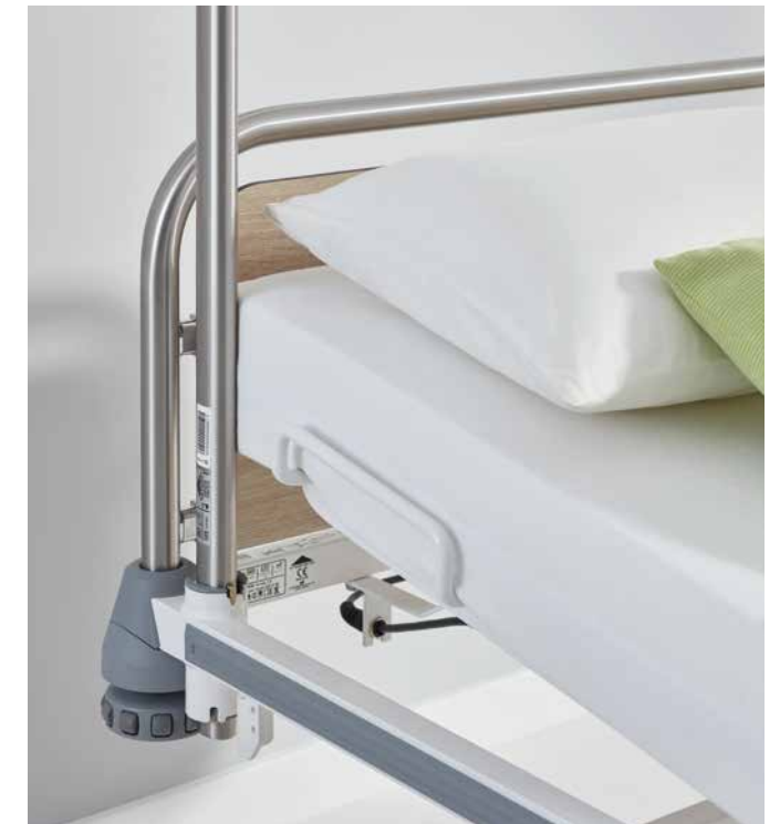
▲ Der Aufrichter kann einfach kopfseitig rechts oder links in die Aufnahmevorrichtungen des Bettes eingesteckt werden.