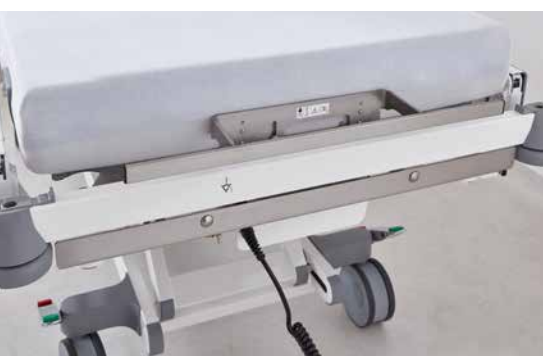
◀ Normschiene an der Rückenlehne.