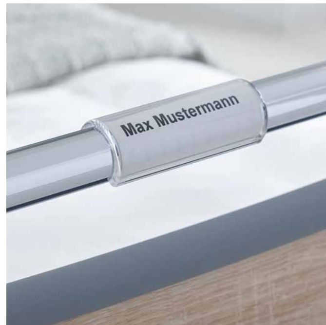
Die Klemmschale für das Namensschild lässt sich flexibel positionieren. ▶

Die Patienten mit Namen ansprechen zu können, schafft Sicherheit und eine vertrauensvolle Atmosphäre und erleichtert die Visite. Unsere Klemmschale für ein Namensschild ist praktisch und hygienisch.