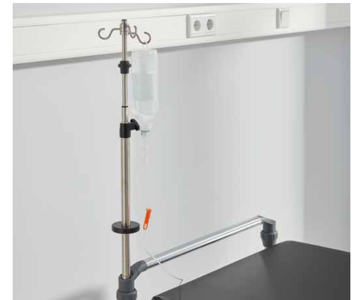
▲ Der teleskopierbare Infusionsständer für den Stretcher Mobilo wird optional platzsparend am Fußende verstaut.