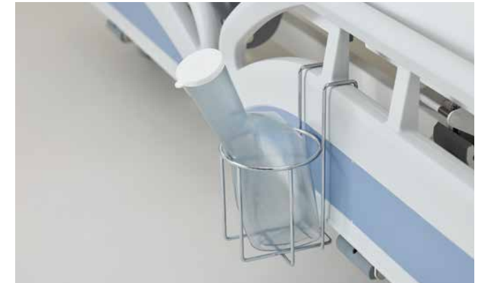
▲ Der Urinflaschenkorb für die Protega-Seitensicherung am Evario.