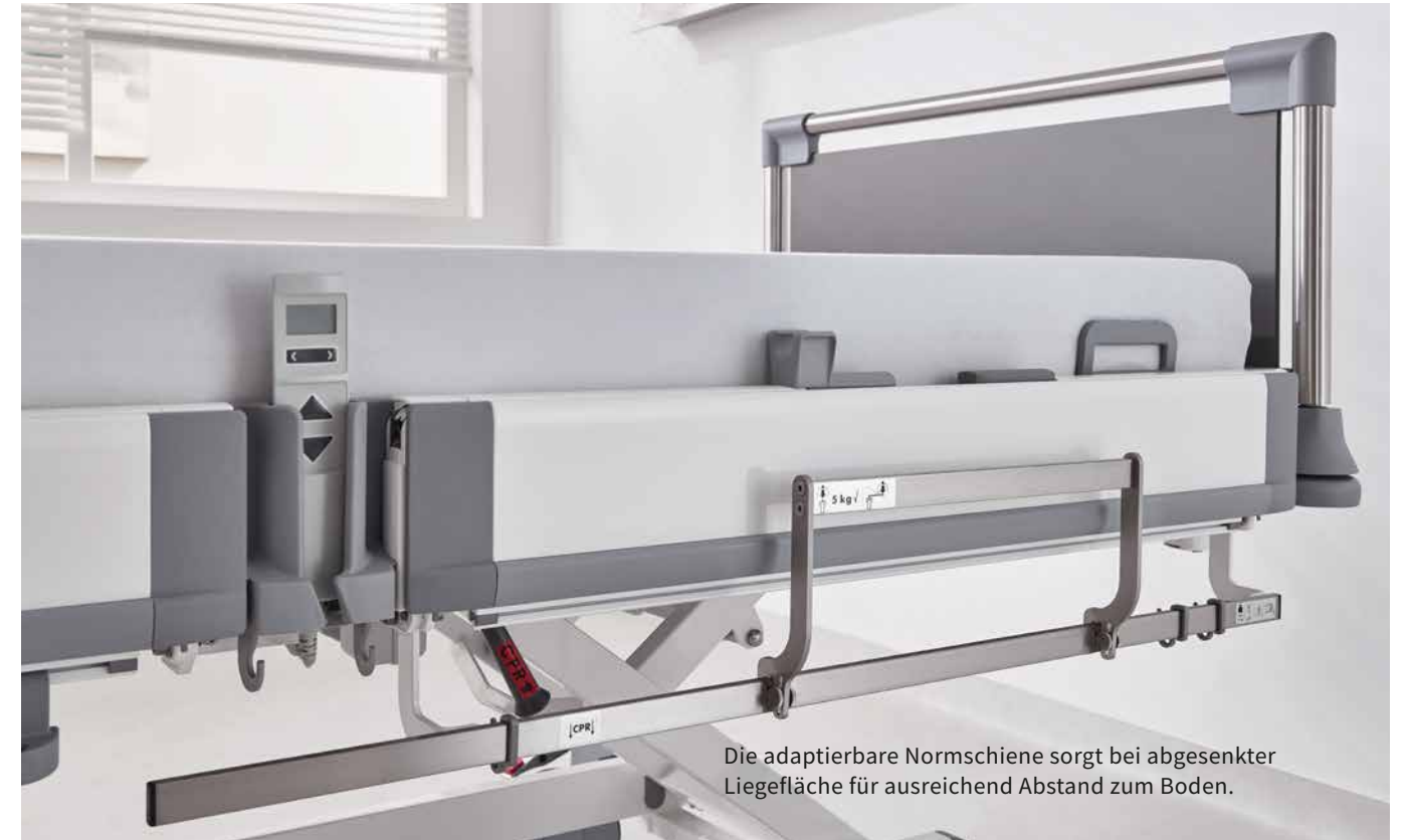
Die adaptierbare Normschiene sorgt bei abgesenkter Liegefläche für ausreichend Abstand zum Boden.