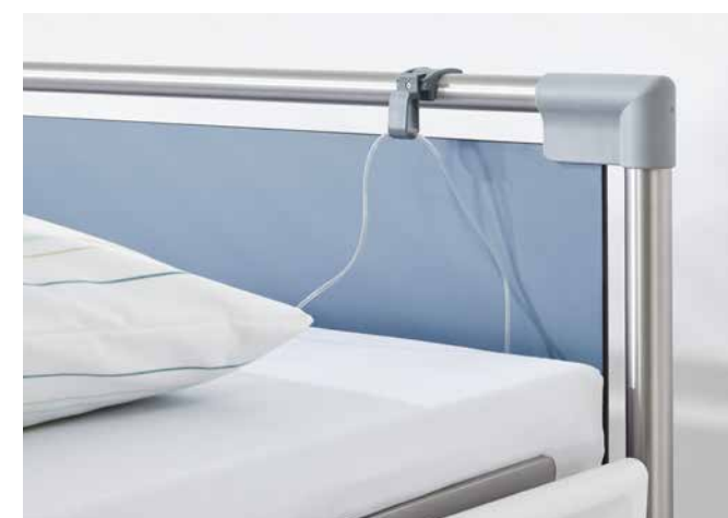
◀ Der Drainageschlauchhalter lässt sich an den Griffleisten der Kopf- und Fußteile befestigen.