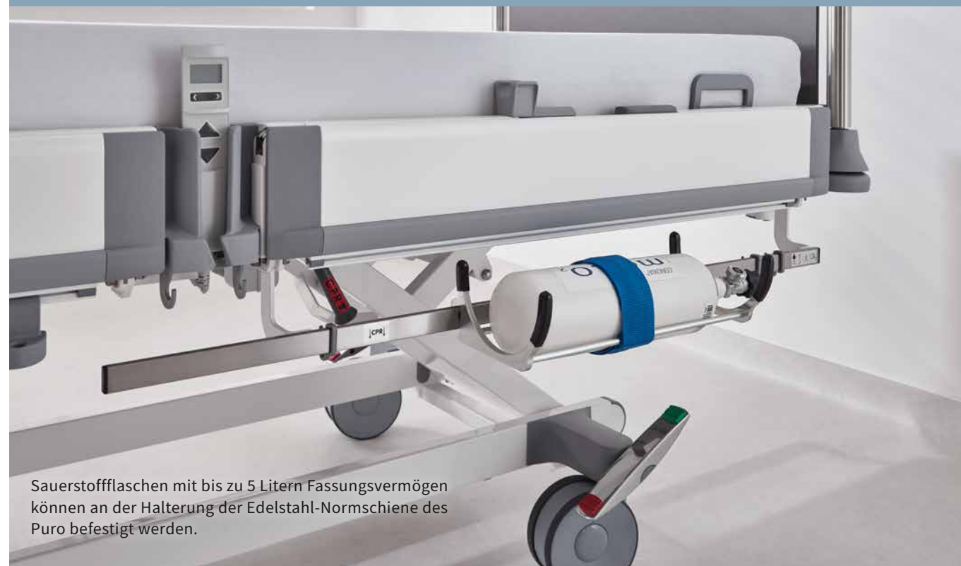
Sauerstoffflaschen mit bis zu 5 Litern Fassungsvermögen können an der Halterung der Edelstahl-Normschiene des Puro befestigt werden.