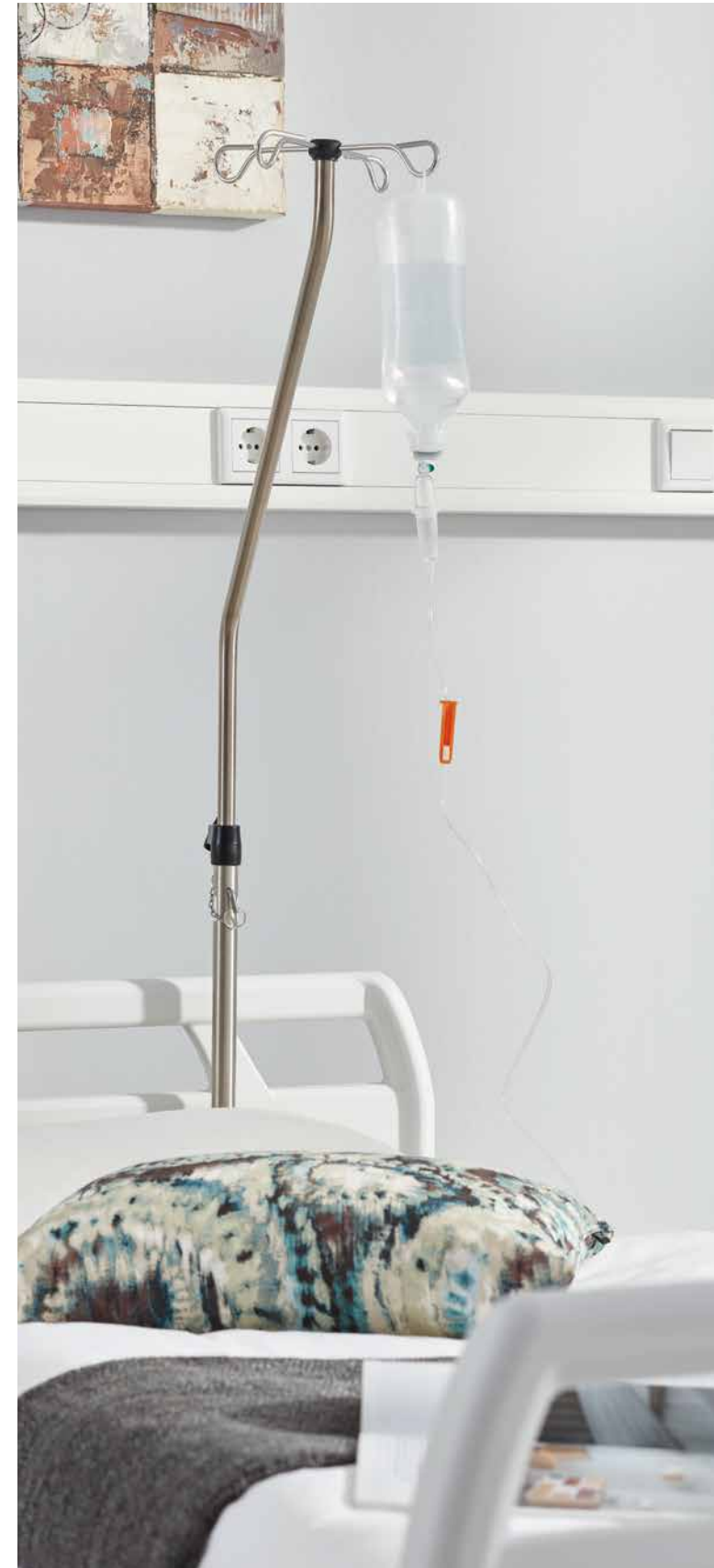
▲ Der Infusionsständer mit 45°-Biegung beugt Kollisionen bei der Verstellung des Bettes vor.