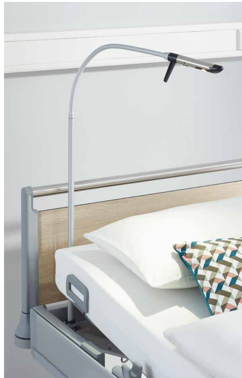
▲ Unsere Leseleuchte Stella spendet den Patienten ein angenehmes, gemühtliches Licht – ohne dabei den Bettachbarn zu stören.