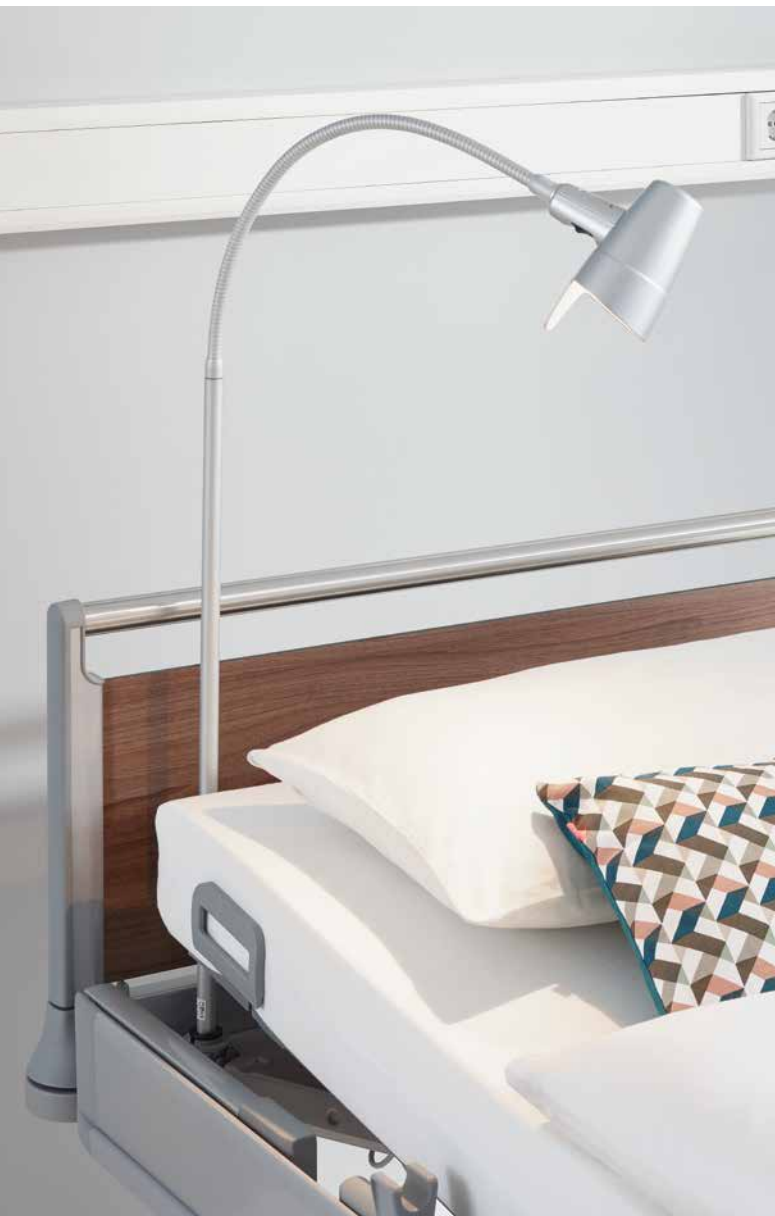
▲ Die Leuchte Sola besitzt einen ansprechend geformten Lampenkopf aus bruchsicherem Kunststoff.

Die LED-Leseleuchte Stella verbindet hochwertiges Design mit einer langen Lebensdauer. Der Leuchtenkopf ist aus hochglanzpoliertem Edelstahl und bietet ein Nacht-Orientierungslicht. Das Modell Stella ist auch in einer Variante zur Anbringung am Nachttisch verfügbar.