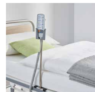
Handschalter immer in Griffnähe