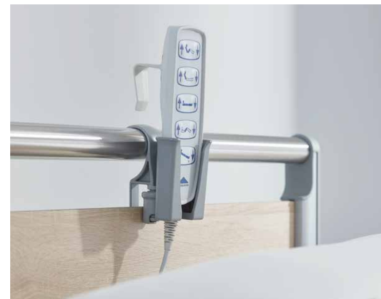
▲ Auch für den Standardhandschalter gibt es einen maßgeschneiderten Köcher.

Handschalter sollen für Patienten und Pflegekräfte immer griffbereit sein. Zugleich sollen sie am Bett sicher aufbewahrt werden können, um Beschädigungen vorzubeugen. Klinikbetten von Stieglmeyer bieten bereits serienmäßig praktische Befestigungsmöglichkeiten.