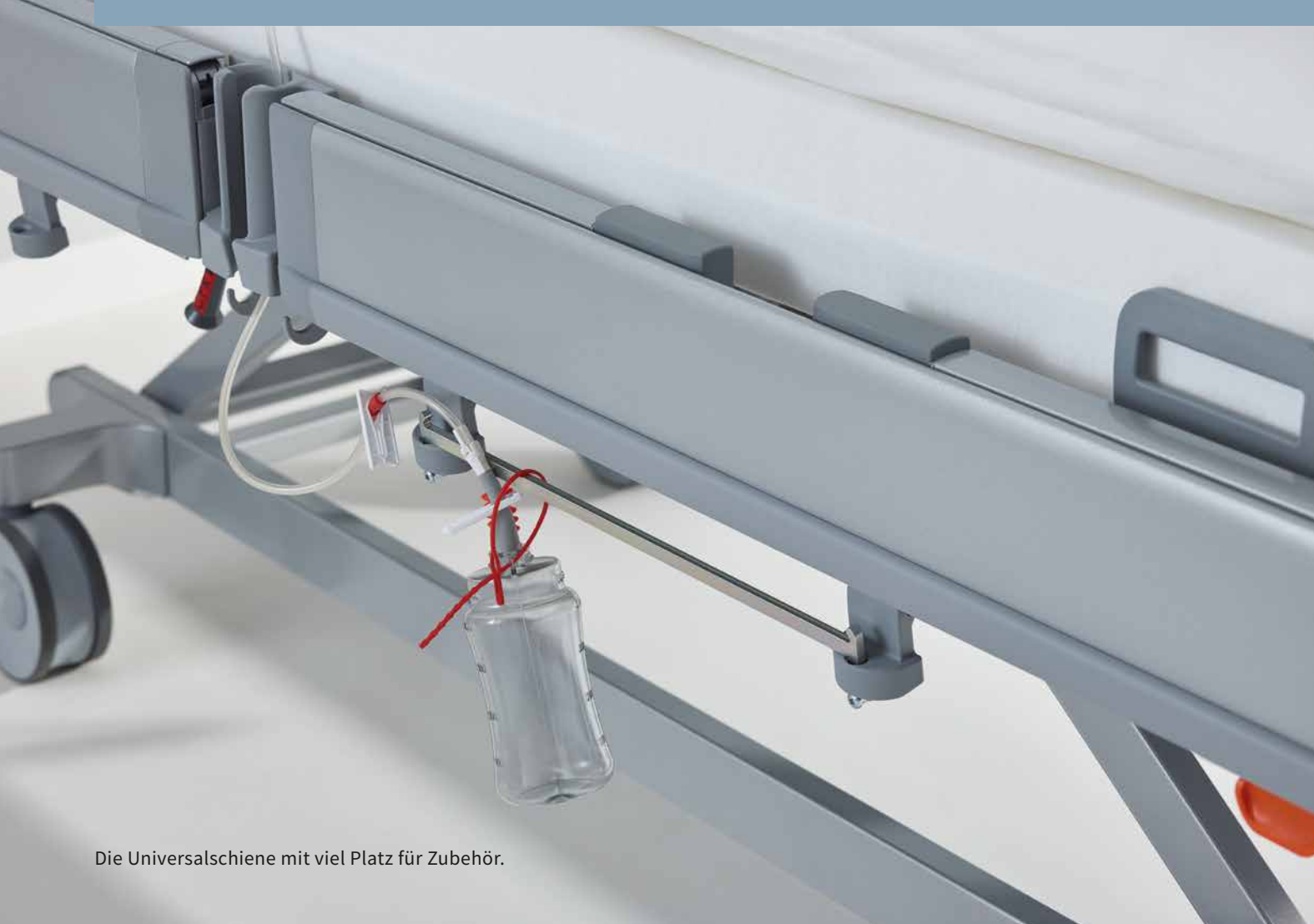
Die Universalschiene mit viel Platz für Zubehör.