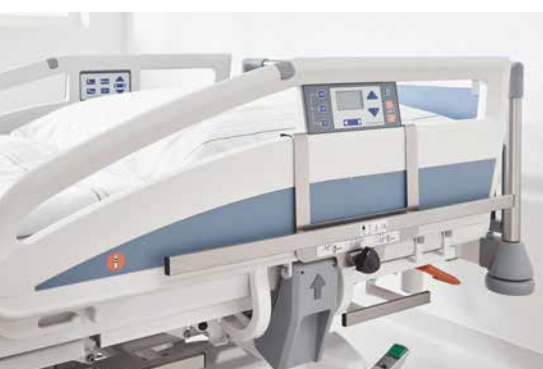
◀ Normschiene an der Protega-Seitensicherung.