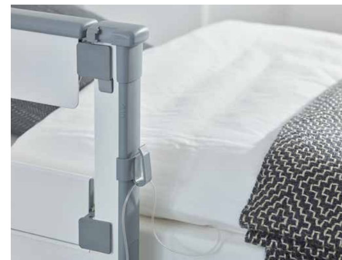
▲ Auch ein Schlauchhalter für die Mobilisierungsstütze der MultiFlex-Seitensicherung ist wählbar.

Unsere Normschiene ermöglichen unter anderem die Positionierung von Drainagebeuteln nahe am Patienten. Um die Drainageschläuche zusätzlich zu sichern, bieten sich praktische Schlauchhalter an. Sie sorgen dafür, dass die Schläuche nicht knicken und geordnet verlegt werden können. Es gibt Halter zur Befestigung an den Griffleisten der Köpfe oder an der Mobilisierungsstütze der MultiFlex-Seitensicherung.