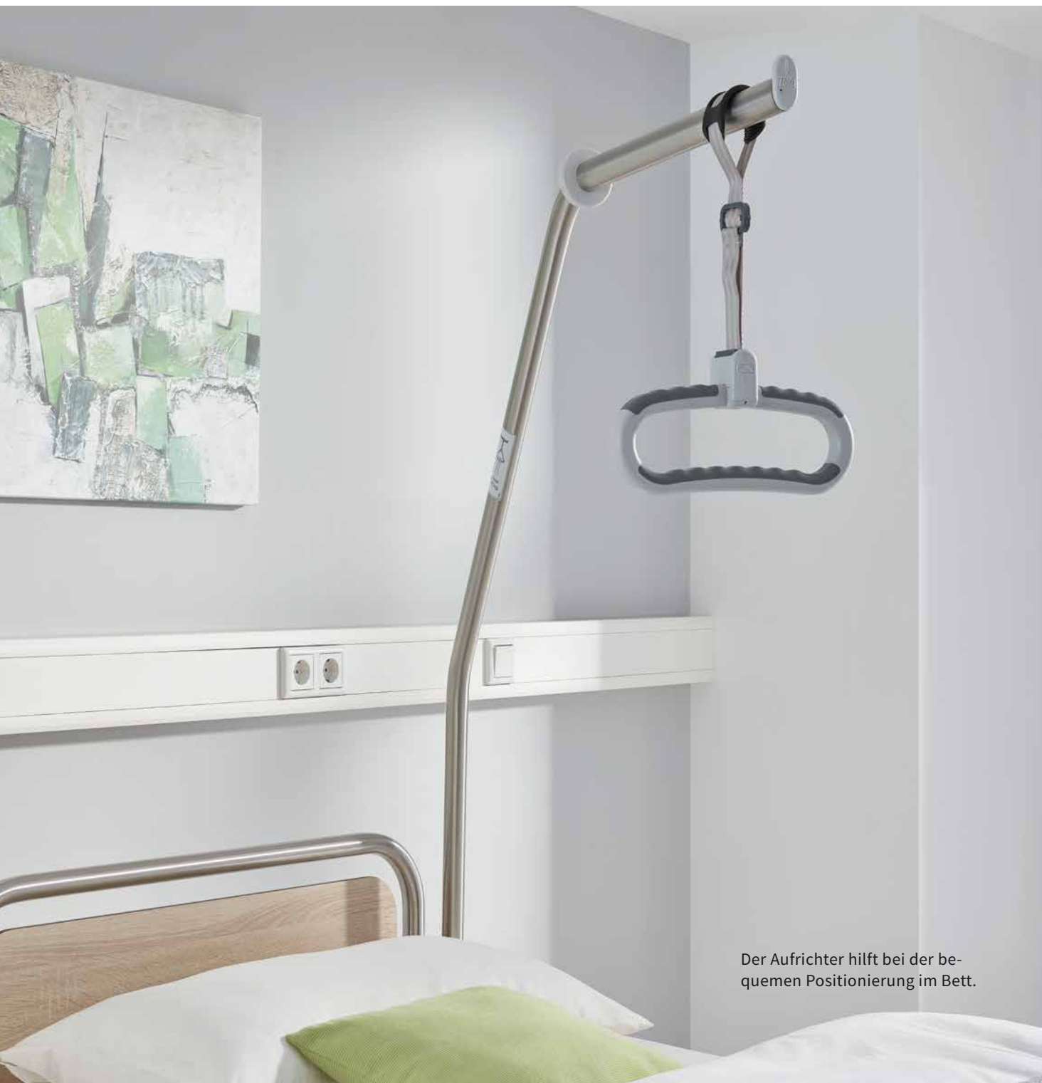
Der Aufrichter hilft bei der bequemen Positionierung im Bett.

Gehhilfen sollten immer griffbereit zur Stelle sein. Unsere praktischen Gehhilfenhalterungen werden einfach an den Kopf- und Fußteilen des Bettes oder an der Reling des Nachttisches angebracht.