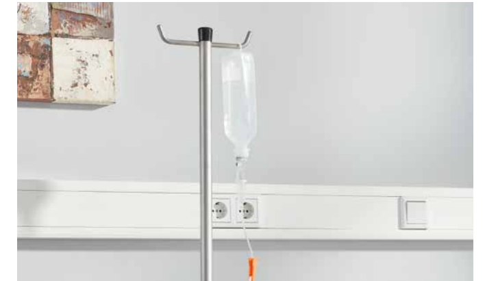
▲ Der Schwerlast-Infusionsstab trägt Lasten von bis zu 10 kg pro Haken.