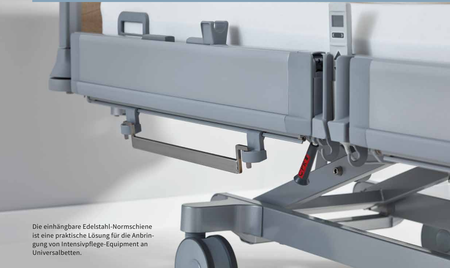
Die einhängbare Edelstahl-Normschiene ist eine praktische Lösung für die Anbringung von Intensivpflege-Equipment an Universalbetten.