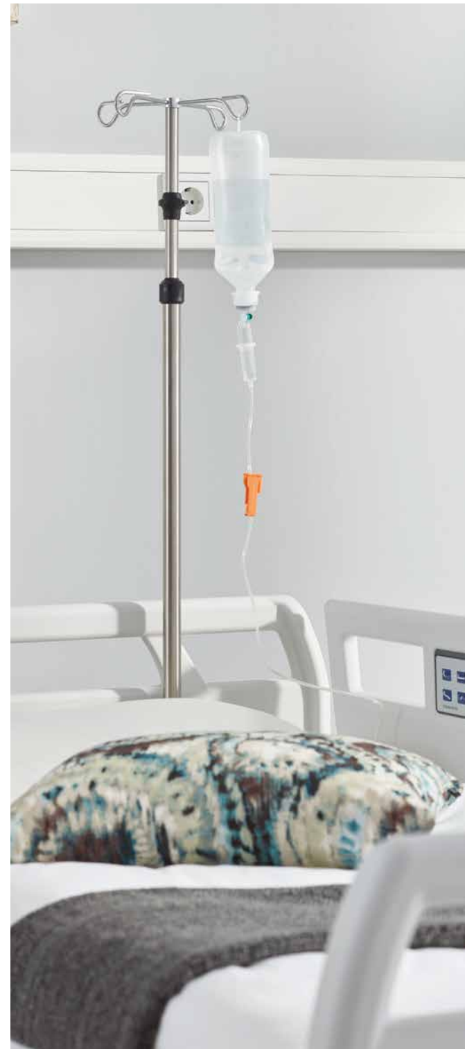
▲ Der senkrechte Infusionsständer ist die klassische Standardlösung.