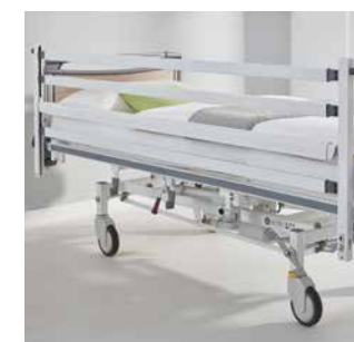
Seitensicherungen für maximalen Schutz