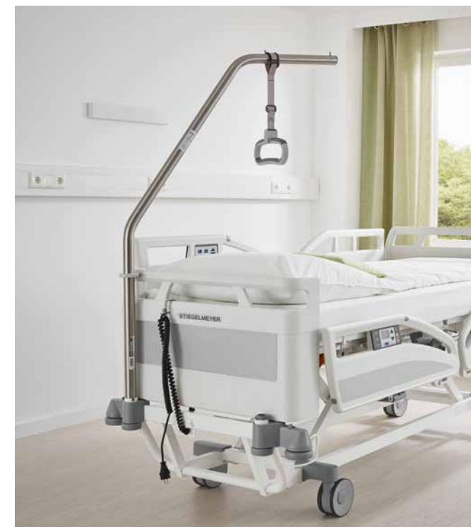
▲ Aufrichter am Evario mit festem Kopfteil.