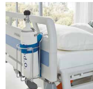
Sicherer Halt für Sauerstoffflaschen