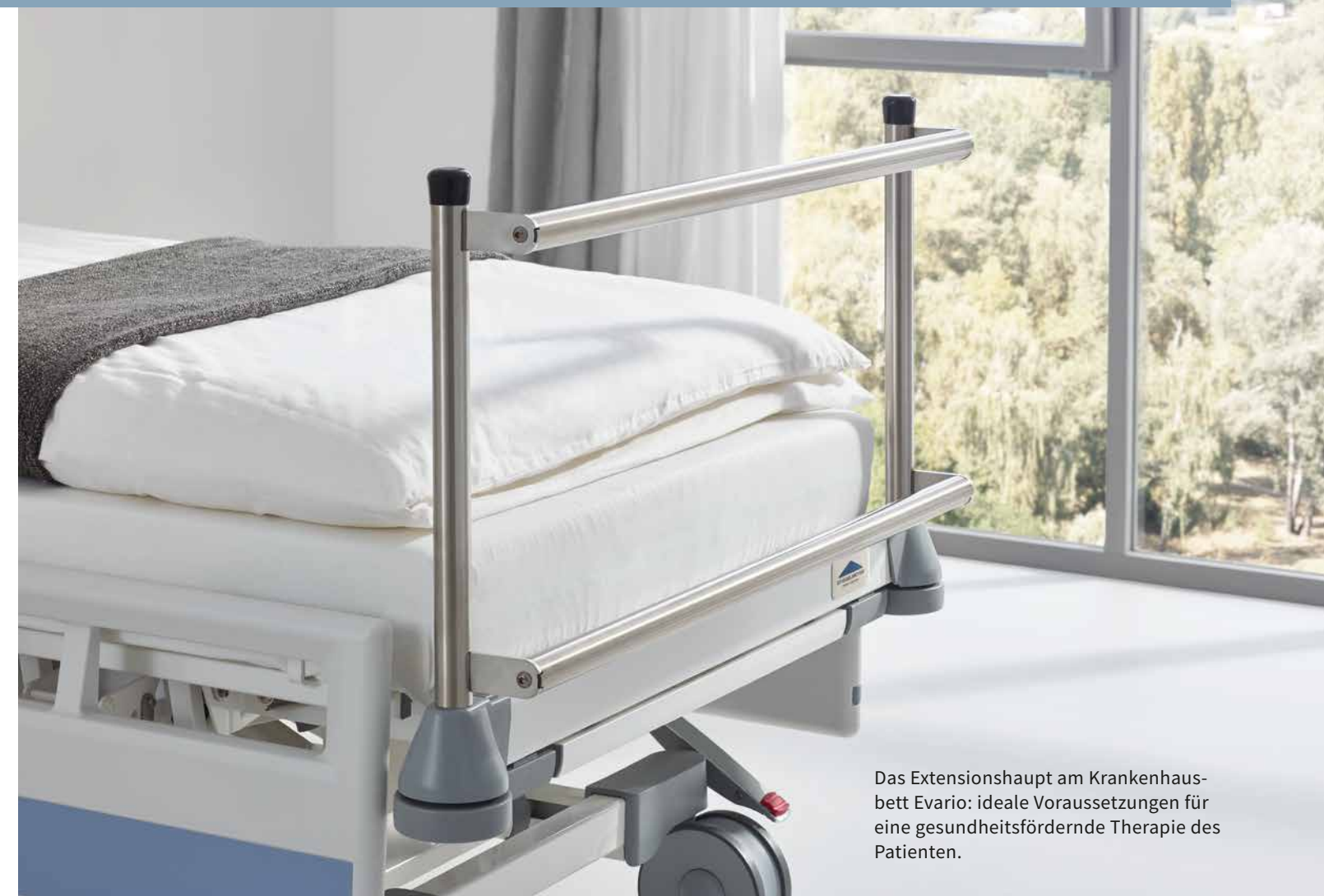
Das Extensionshaupt am Krankenhausbett Evario: ideale Voraussetzungen für eine gesundheitsfördernde Therapie des Patienten.