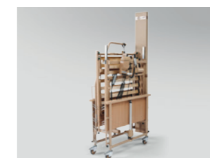
Platzsparende Auslieferung und Lagerung auf Lager-/Transporthilfe (Abb. ähnlich)