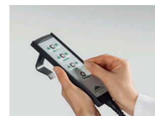
Handschalter mit selektiver Sperrfunktion