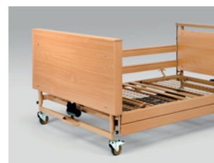
Holzfüllung zur Verkleidung des Fahrgestells (auch nachträglich montierbar)