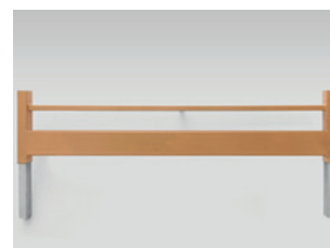
Bettverlängerung (auch nachträglich montierbar)