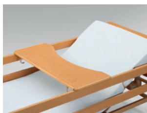
Servierblech für Allura II und Allura II 100