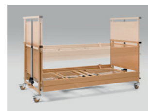
Verstellbereich von 30 bis 80 cm