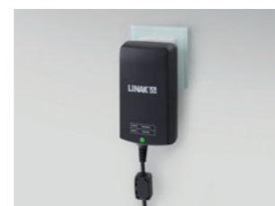
Elektronisches Schaltnetzteil (Switch Mode), direkt hinter Netzstecker integriert