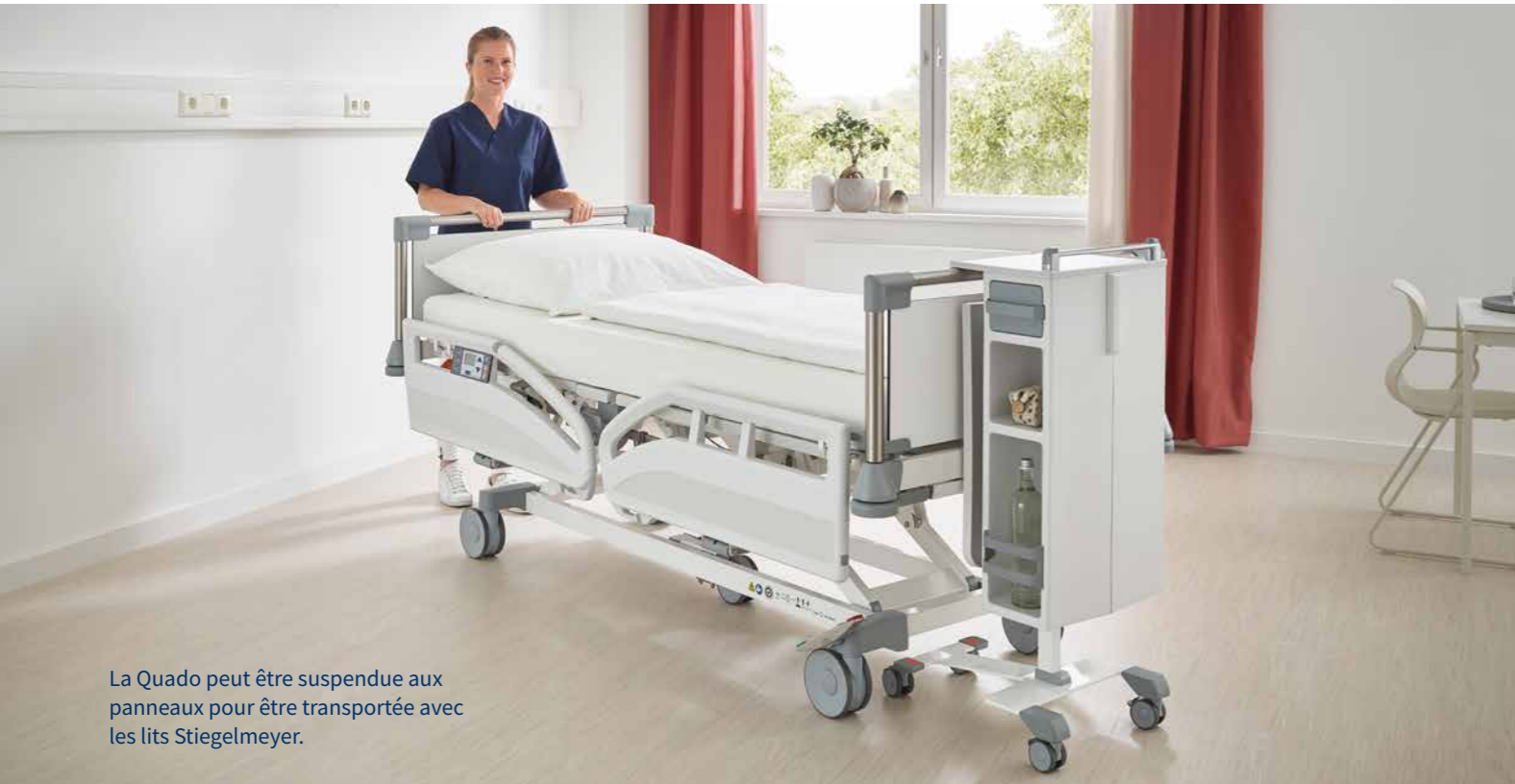
La Quado peut être suspendue aux panneaux pour être transportée avec les lits Stiegmeyer.