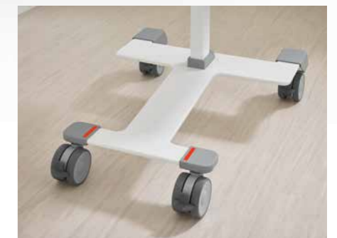
Das Untergestell sorgt für eine hohe Standfestigkeit und lässt sich einfach reinigen.

Der Quado ist maschinell waschbar und auch manuell schnell aufzubereiten. Dies sorgt für eine optimale Hygiene im Krankenhaus.