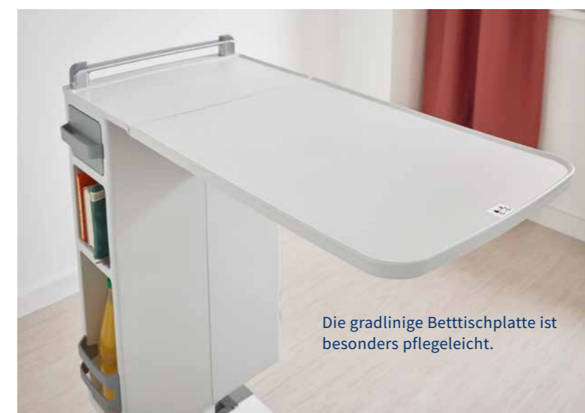
Die gradlinige Bettischplatte ist besonders pflegeleicht.