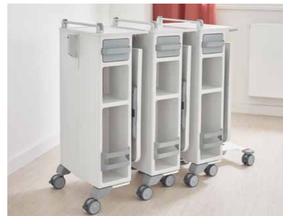
Die Quado-Nachttische lassen sich zum Lagern platzsparend ineinander schieben.

über Schwellen oder bei Hindernissen sollte er über die Höhenverstellung des Bettes angehoben werden. Ist der Quado am Zielort angekommen, lässt er sich dank seiner bremsbaren Rollen sicher neben dem Bett platzieren.