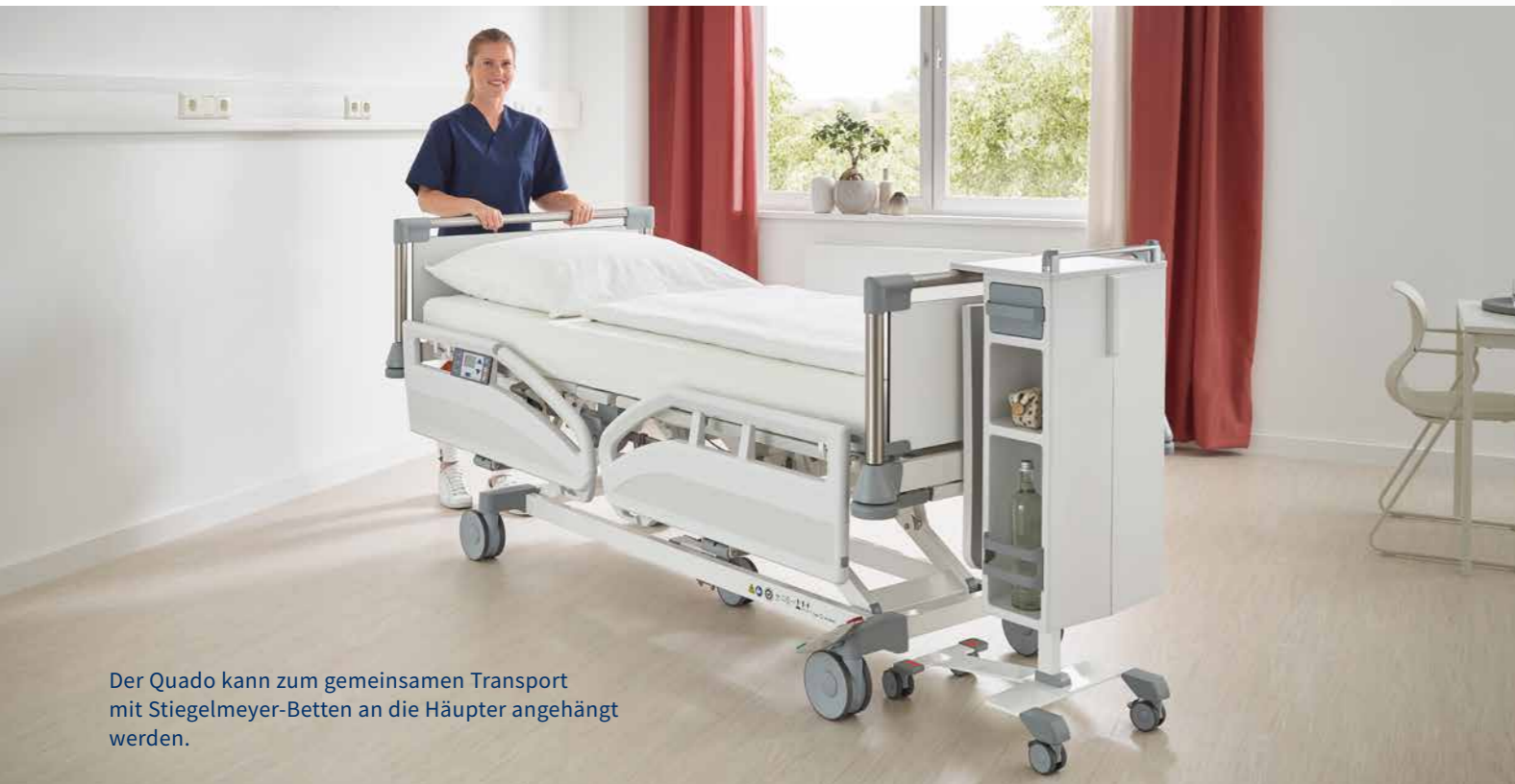
Der Quado kann zum gemeinsamen Transport mit Stieglmeyer-Betten an die Häupter angehängt werden.