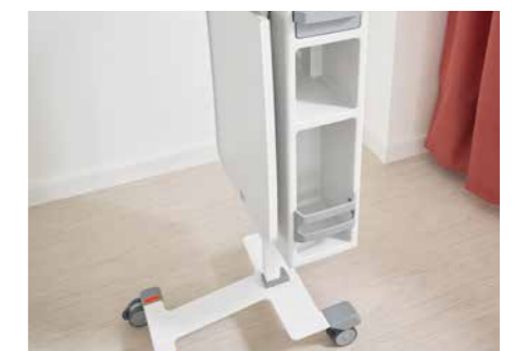
Die reinigungsfreundliche Formgebung verleiht dem Quado gute Hygieneigenschaften.