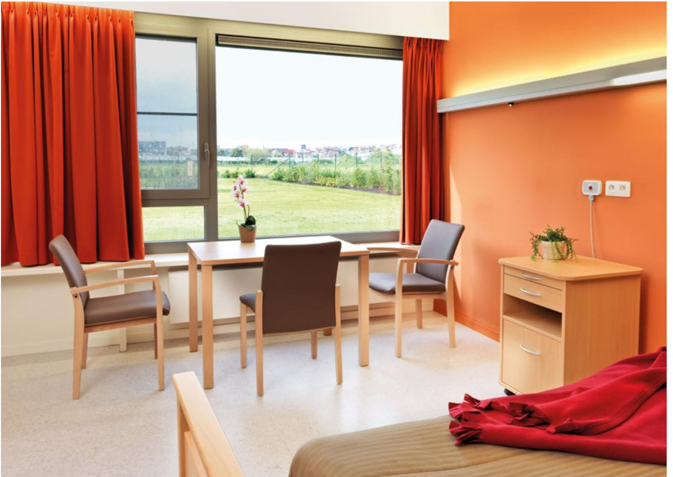
Centre de soins de santé De Ril, Middelkerke