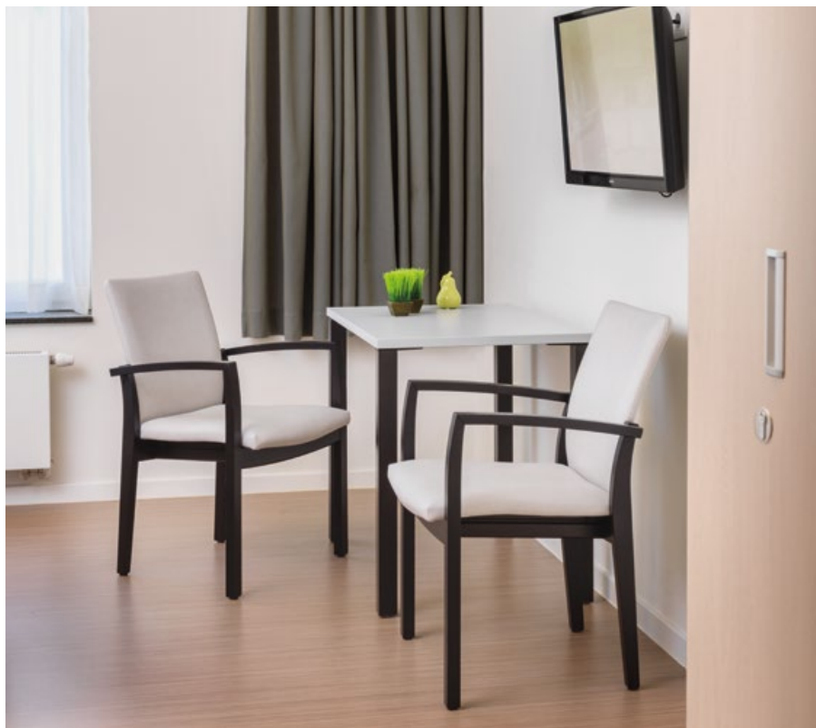
Centre de soins de santé De Vlinder, Harelbeke