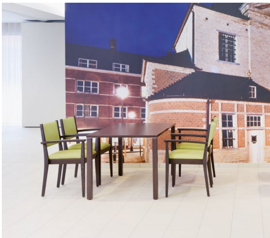
Centre de soins de santé Paradijs, Lierre