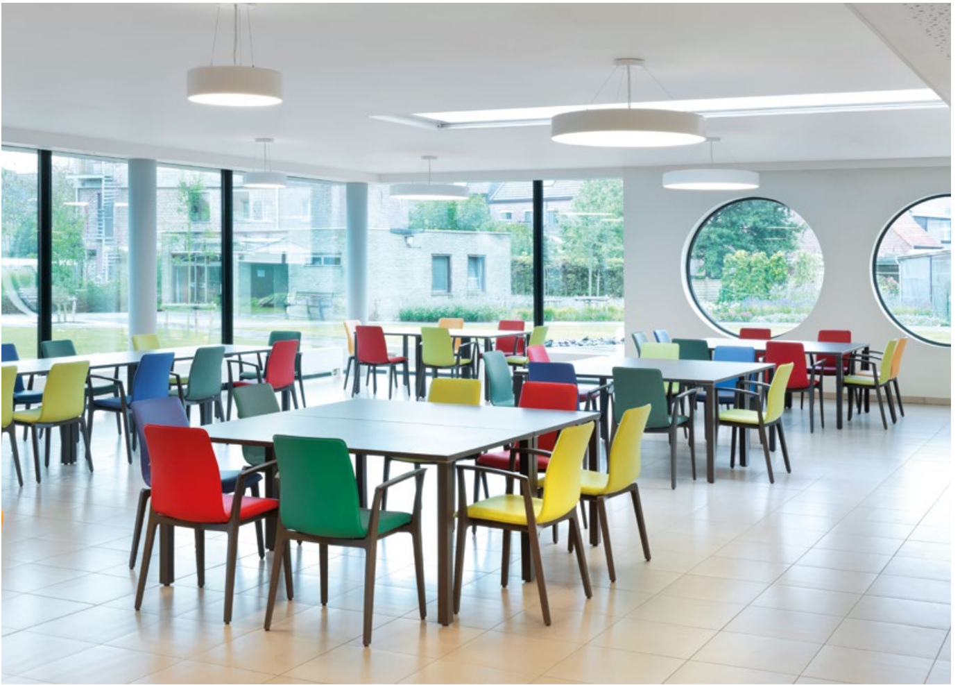
Centre de soins de santé Rustenhove, Ledegem