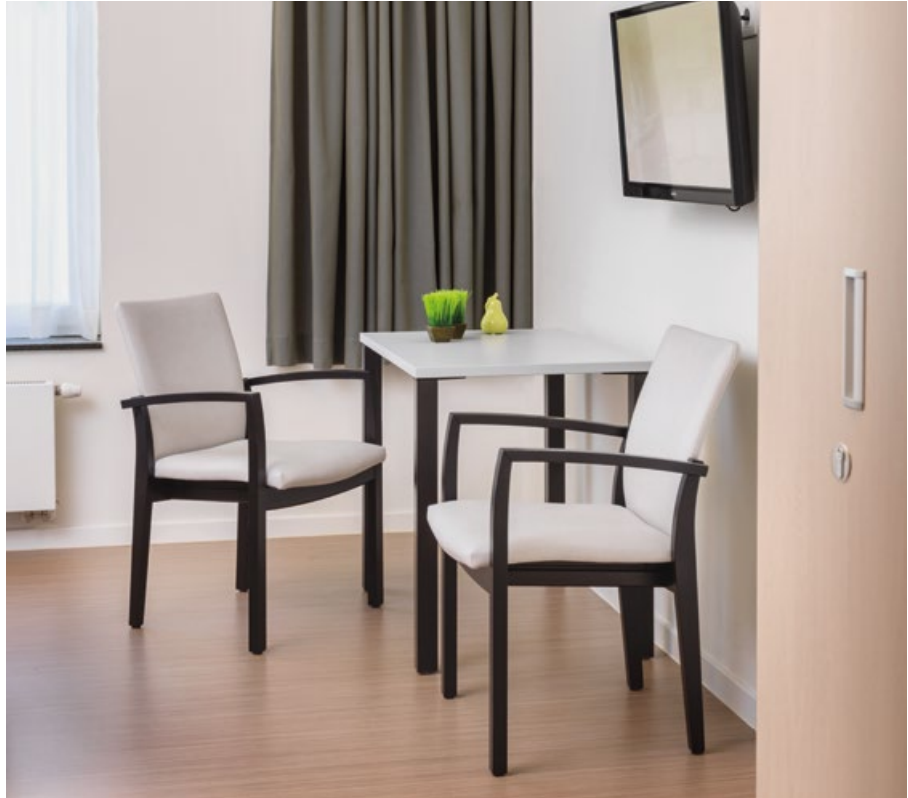
WZC De Vlinder, Harelbeke