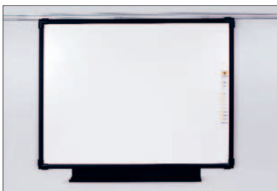
Tableau interactif eBoard

Dimensions 150 x 150 cm / 180 x 180 cm Cadre en aluminium / chants ABS