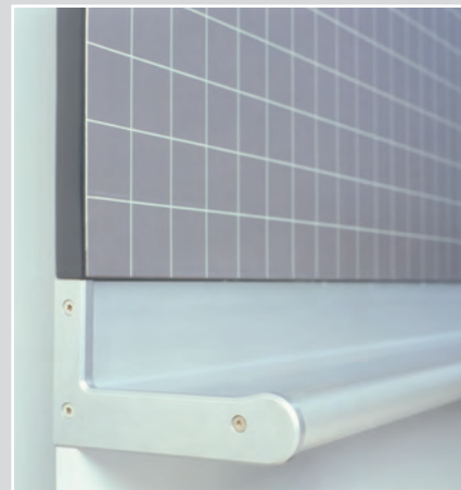
Kreidebrett Alu mit gerundeter Kante