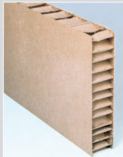
Panneau en nid d'abeille