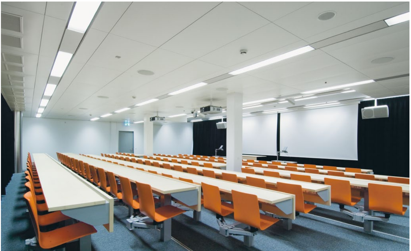
Uni Zürich, Cityport, 2010 Zweierschwenksitze. Deux chaises avec système pivotant.

Le travail d'ingénieur précis pour chaises en bois rabattables avec ou sans revêtement et aussi deux chaises avec système pivotant avec ou sans aération fait partie de nos points forts.