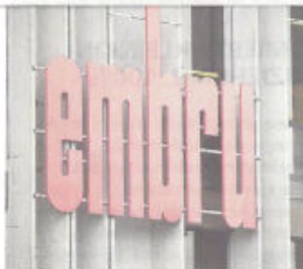
Der bekannte Firmenschriftzug.