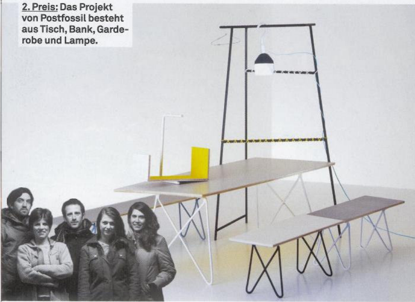
2. Preis: Das Projekt von Postfossil besteht aus Tisch, Bank, Garderobe und Lampe.