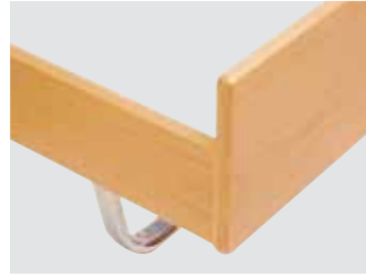
Nussbaum furniert, naturlackiert weiss lackiert