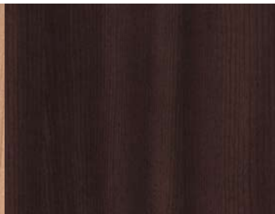
Wodego After Eight R5447 VV

Pour des raisons d'impression, les coloris et décors peuvent différer légèrement de la teinte originale.