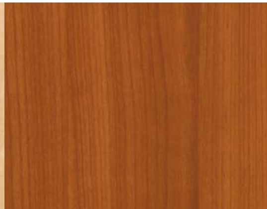
Wodego Cerisier classique R5360 VV