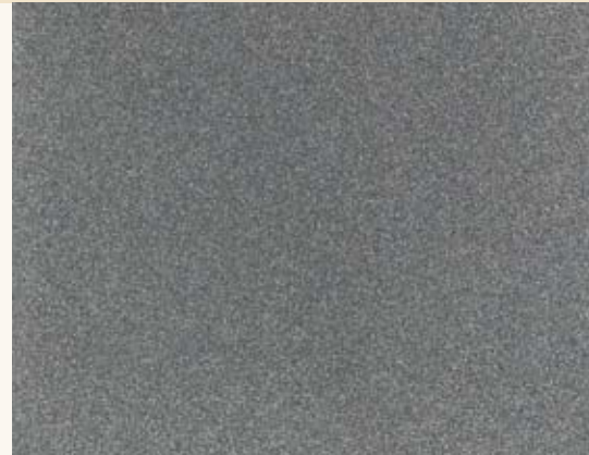
Coloris de châssis Argentum

Les éléments fabriqués en bois massif sont teintés pour s'harmoniser aux décors. Naturellement, nous nous ferons un plaisir de vous conseiller dans le choix de vos décors.