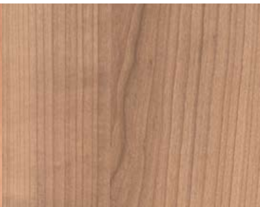
Wodego Havanna R5681 VV