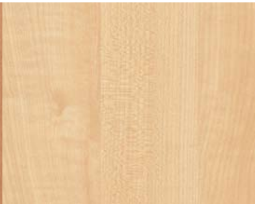
Wodego Erable royal R5184 VV