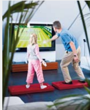
Mehr Spass beim Spielen.