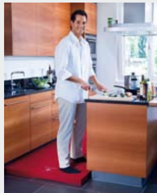
Federleicht gesund kochen.