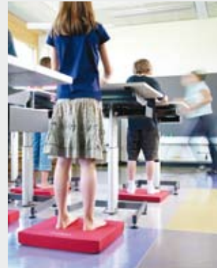
Konzentrierter und federleicht lernen.